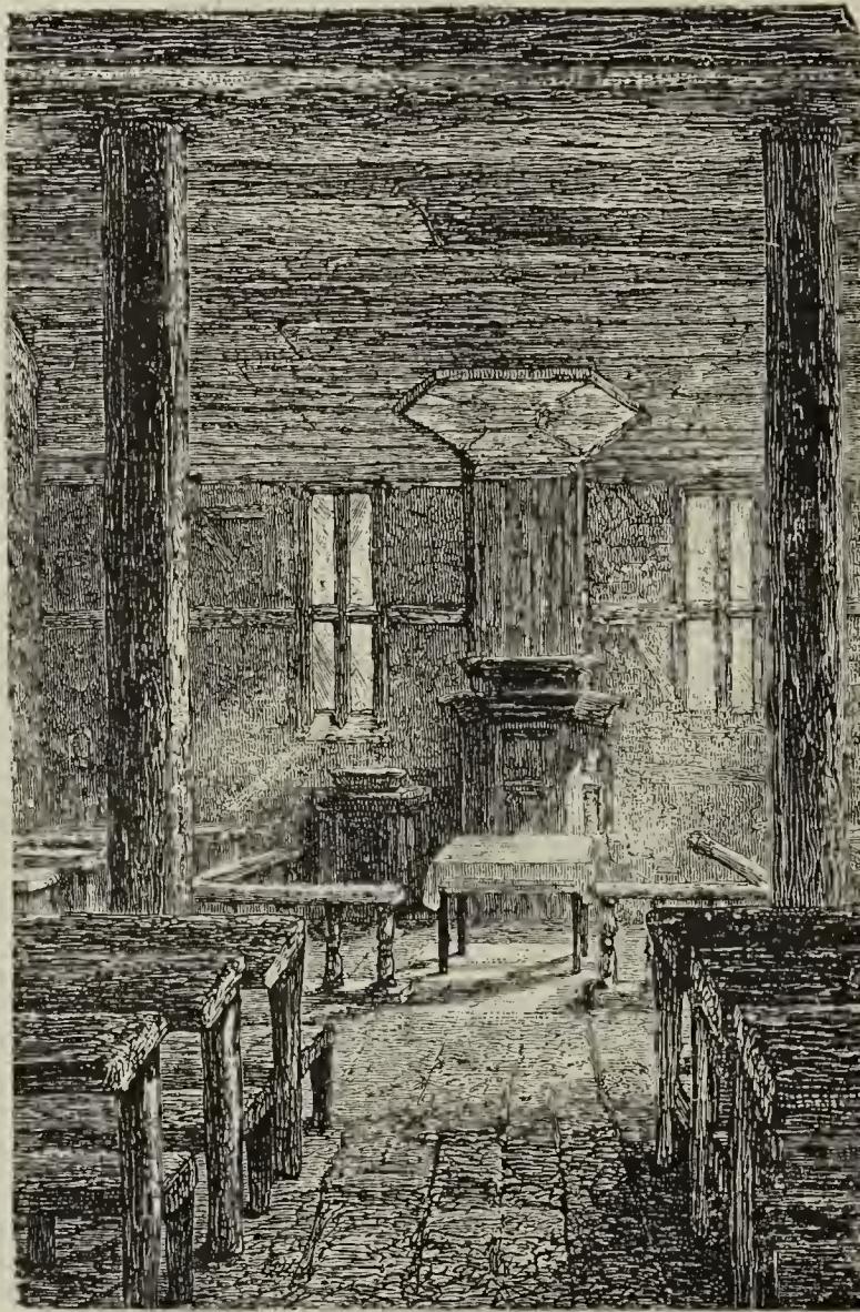
Templo de Schöenberg (Württemberg), donde se halla la tumba de Arnaud

munidad. El orden del culto era el mismo de todas las Congregaciones valdenses.